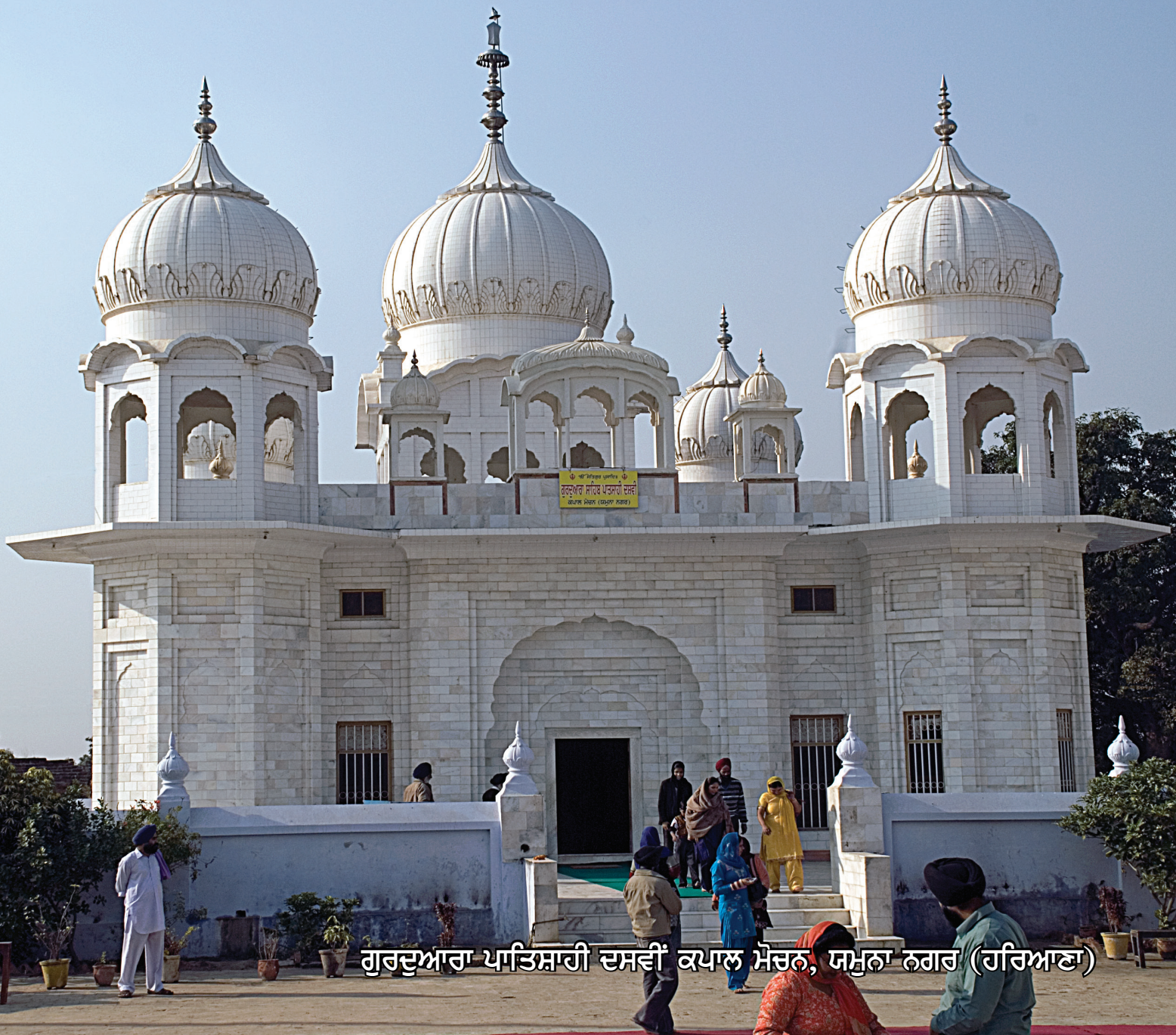
ਗੁਰਦੁਆਰਾ ਪਾਤਿਸ਼ਾਹੀ ਦਸਵੀਂ ਕਪਾਲ ਮੈਚਨ, ਯਮੁਨਾ ਨਗਰ (ਹਰਿਆਣਾ)