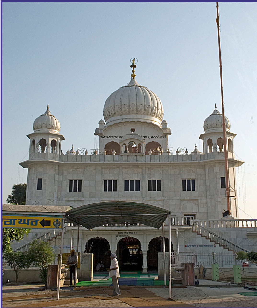
ਗੁਰਦੁਆਰਾ ਭੱਠਾ ਸਾਹਿਬ, ਰੋਪੜ (ਪੰਜਾਬ)